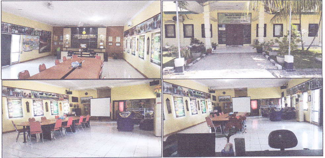
Gambar 1. Sekretariat PPID Pelaksana BBPP Kupang