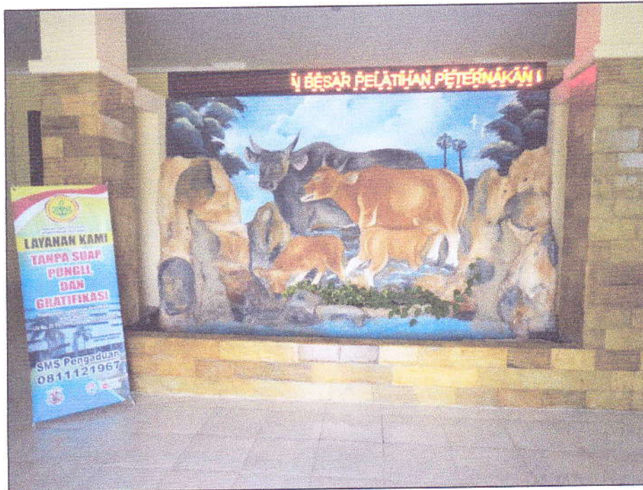
Gambar 3. Poster Layanan Tanpa Suap, Pungli, dan Gratifikasi di BBPP Kupang