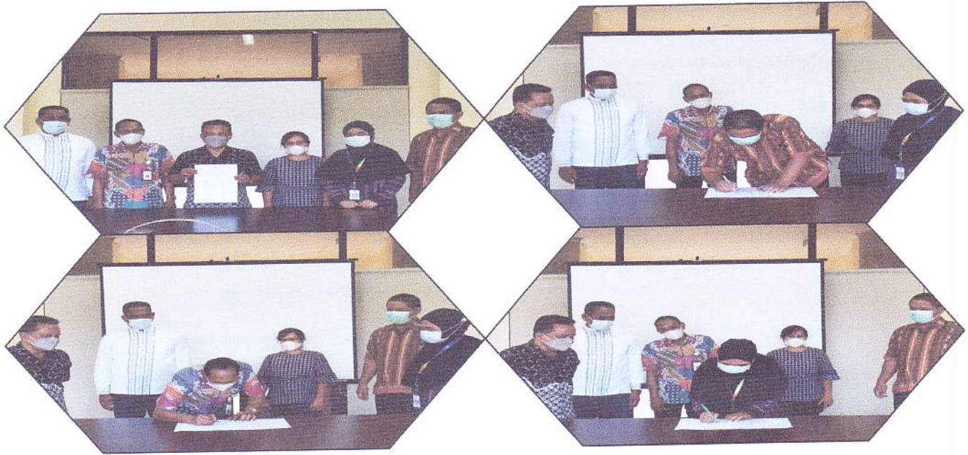
Gambar 5. Penandatanganan Komitmen Bersama