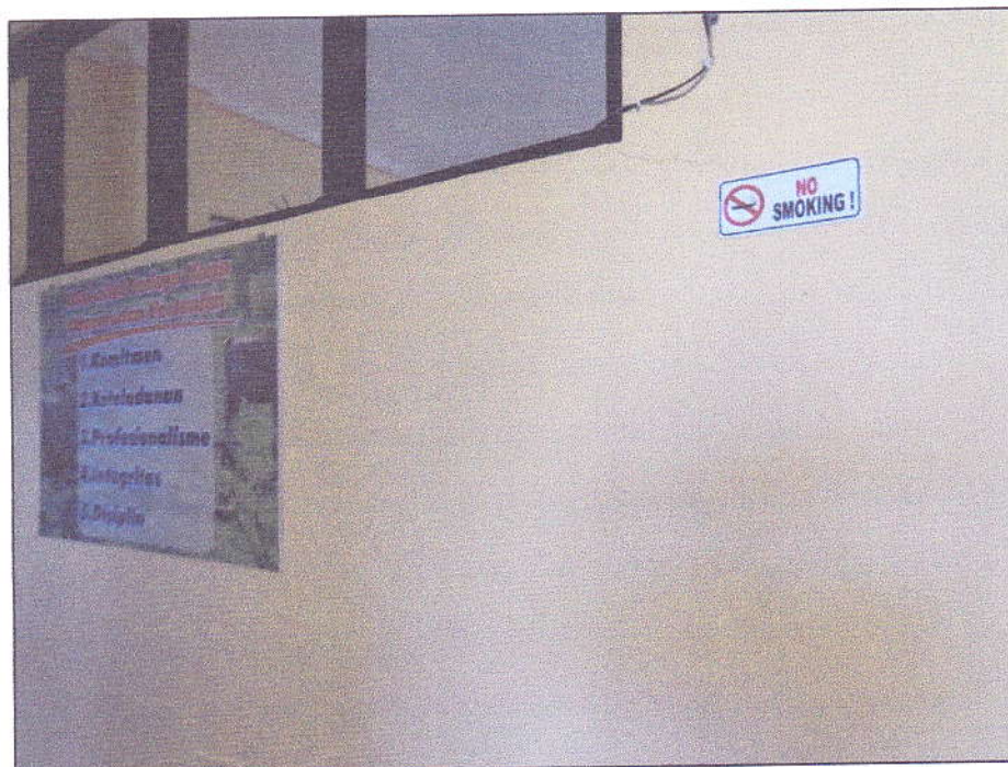
Gambar 4. Himbauan Larangan Merokok di Lingkungan Kantor BBPP Kupang