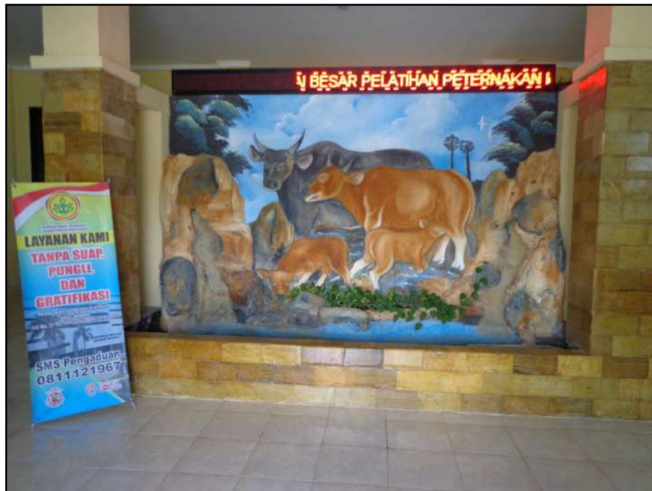
Gambar 3. Poster Layanan Tanpa Pungutan di Konter Layanan Informasi