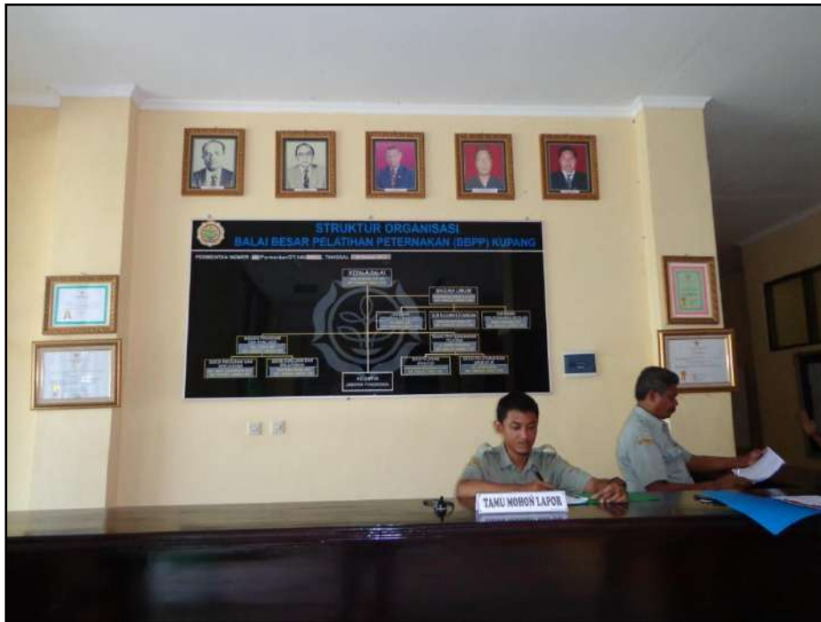
Gambar 1. Petugas Harian PPID di Konter Layanan Informasi