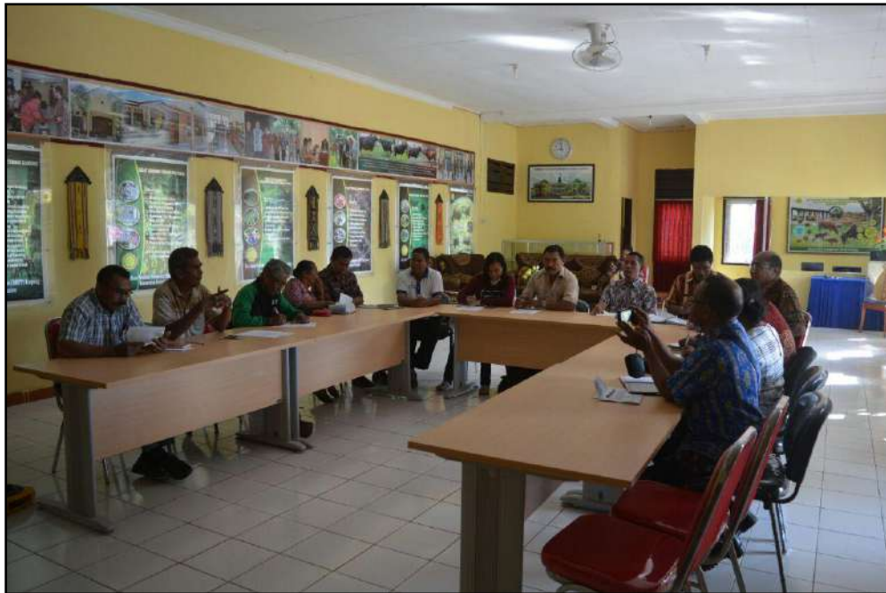
Gambar 7. Sosialisasi Pengelolaan Data dan Informasi Pusat Pelatihan Pertanian dan Perdesaan Swadaya (P4S) Berbasis Aplikasi Short Message Service (SMS) dan Website (11-8-2016)