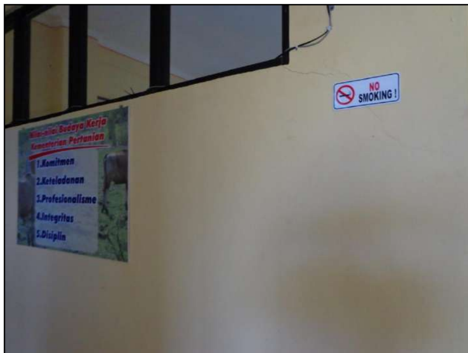
Gambar 4. Himbauan Larangan Merokok di Lingkungan Kantor BBPP Kupang