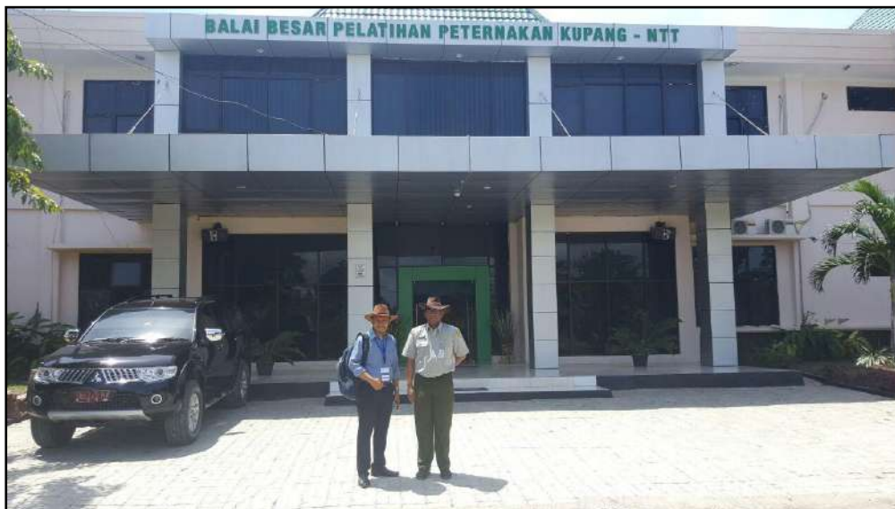
Gambar 8. Kunjungan konsultan PLAN International Jakarta ke BBPP Kupang (15-9-2016)