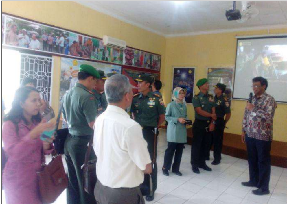
Gambar 5. Kunjungan Staf Ahli Mentan Bidang Infrastruktur dan Dandim se-NTT di Ruang Public Service Center BBPP Kupang (3-8-2016)