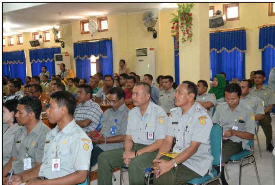
Gambar 10. Peserta Sosialisasi Upsus Siwab yang dihadiri dari Dinas Peternakan Kab/Kota se-Provinsi NTT di BBPP Kupang (28-11-2016)