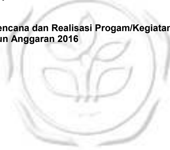
Tabel 11. Rencana dan Realisasi Progam/Kegiatan BBPP Kupang Tahun Anggaran 2016

Rencana dan realisasi kegiatan BBPP Kupang Tahun Anggaran 2016 selengkapnya termuat dalam tabel berikut ini.